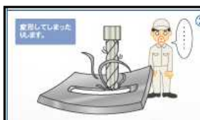
イラスト ポイント 説明 で分かり易い！